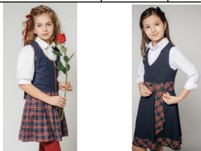
М-1 (склада 1:3) М-2 (А-силуэт)