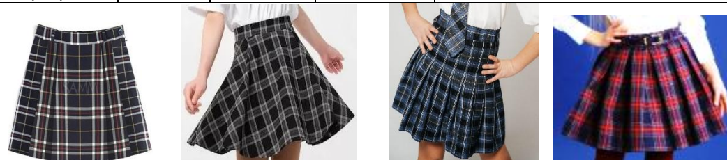
М-1 (2 встречные)